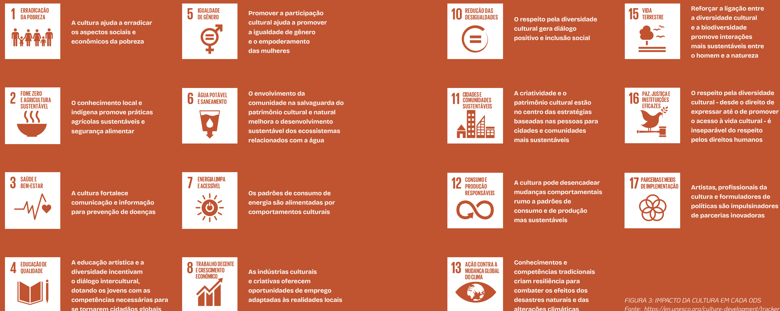
FIGURA 3: IMPACTO DA CULTURA EM CADA ODS