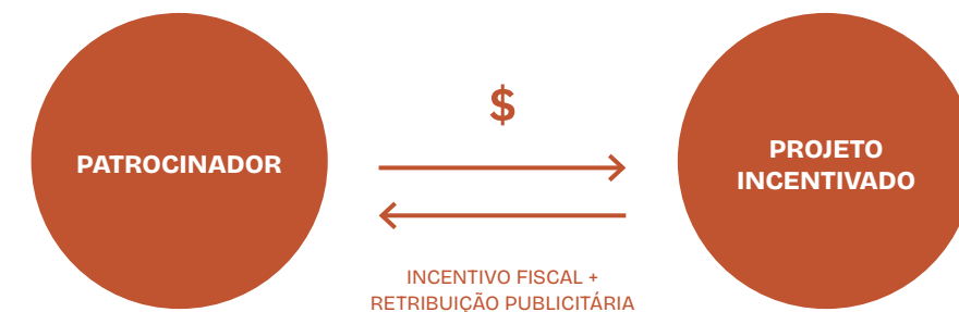
FIGURA 2: Modelo de incentivo com aprovação prévia de projeto

Podemos afirmar que a concessão de incentivos fiscais para empresa patrocinadora de projetos culturais passou a ser, a partir da década de oitenta, uma escolha regular dos governantes, como forma de viabilizar as produções culturais, ou melhor, como parte de sua política cultural.